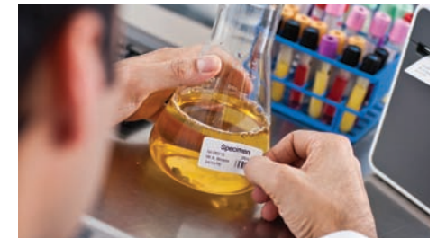
Identifiez clairement les échantillons de vos patients