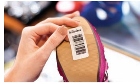
Plusieurs types d'étiquettes peuvent être imprimées avec les TD-2000

Les rouleaux Brother RD ne contiennent pas de Bisphénol-A, une matière utilisée souvent dans la création d'étiquette. Les étiquettes RD peuvent donc être utilisées sur des produits alimentaires et ne posent aucun danger pour la santé des nourrissons et des jeunes enfants.