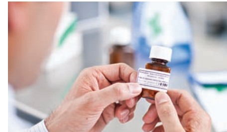
Plusieurs tailles d'étiquettes peuvent être utilisées