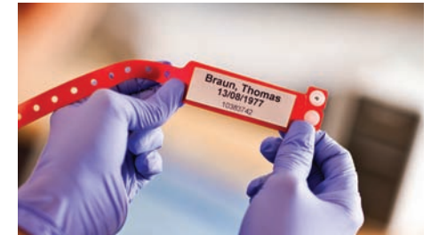
Imprimez des données patients à tout moment