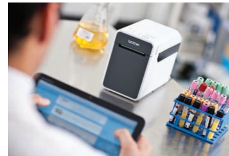
Plus de liberté et de mobilité - imprimez sans fil à partir d'un Smartphone ou d'une tablette

Compatible avec des applications ZPL sans coût de développement supplémentaires. Branchez la TD-2000 et ajustez les configurations internes pour utiliser avec un