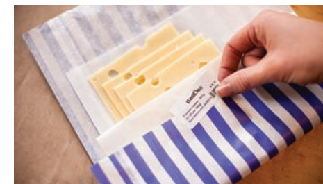
Offrez un service irréprochable en affichant sur les étiquettes des indications de sécurité.