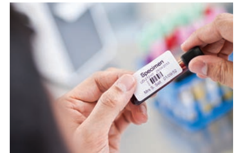
Simplement appliquez votre style d'étiquette personnalisée