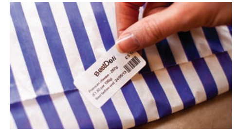
L'adhésif utilisé sur les rouleaux RD est certifié pour des produits alimentaires