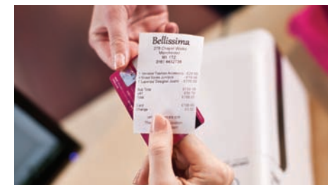
Imprimez des reçus de bonne qualité pour vos clients